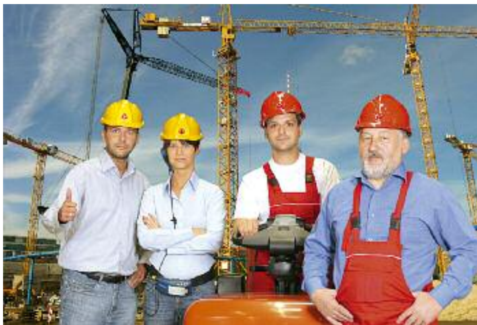
Die BauRente ZukunftPlus bietet viele Optionen

Wer noch genügend Vermögen hat, um für sich und seine Angehörigen zu sorgen, muss zunächst dieses Vermögen für seinen Lebensunterhalt „verbrauchen“, bevor er Anspruch auf Arbeitslosengeld II hat. Zu diesem Vermögen können unter bestimmten Voraussetzungen auch Rentenversicherungen gehören, die dann gekündigt werden müssten, um mit der ausgezahlten Summe den Lebensunterhalt zu bestreiten. Die BauRente ZukunftPlus gehört nicht zu diesem verwertbaren Vermögen, da eine Verwendung vor Eintritt des Versorgungsfalles ausgeschlossen ist. Das angesparte Vermögen bei der BauRente ZukunftPlus ist also sicher; es wird bei der Berechnung des Arbeitslosengeldes II nicht berücksichtigt („Hartz IV-Festigkeit“).