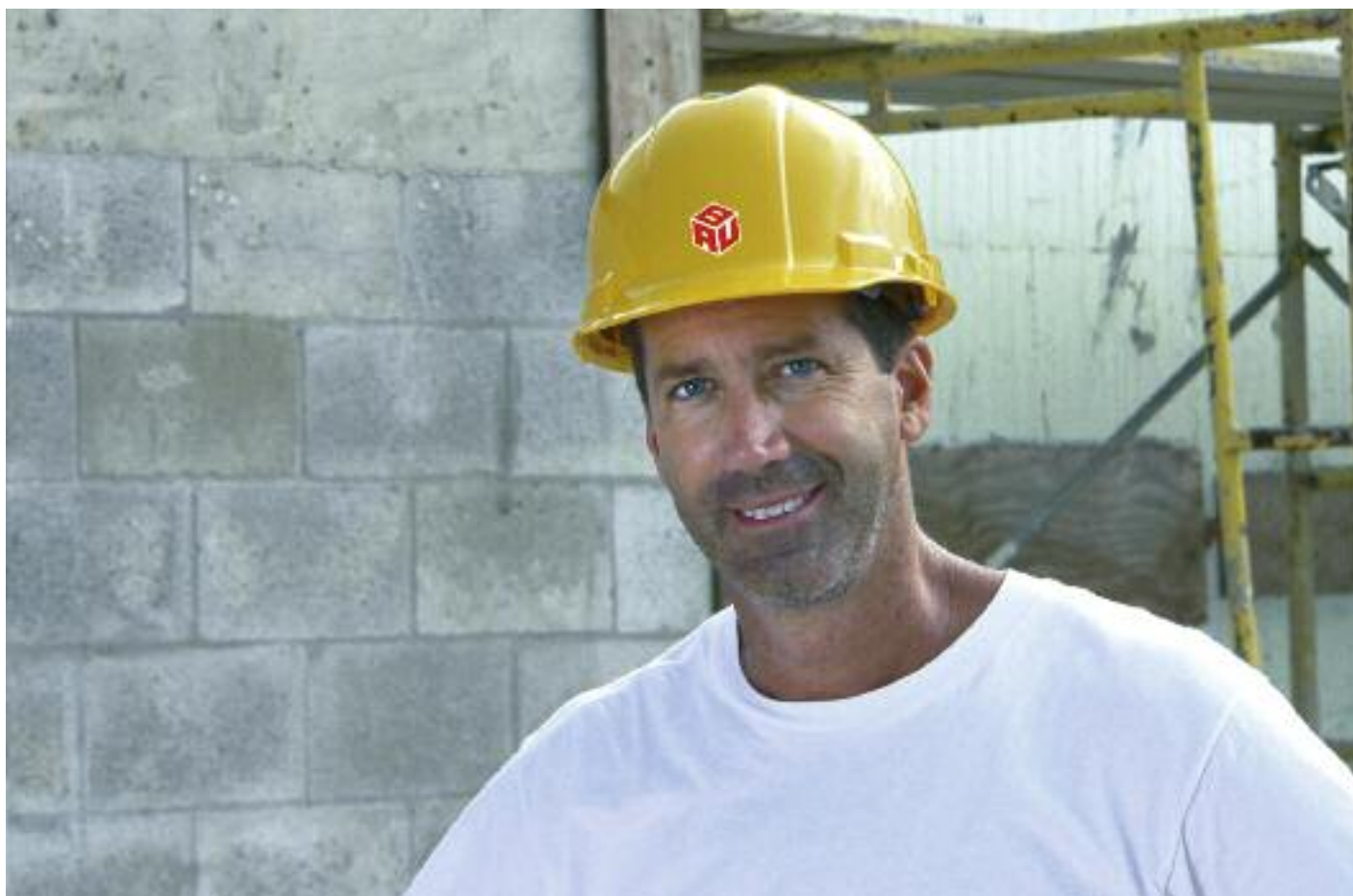
Tarifliche Zusatz-Rente: in vielen Branchen möglich