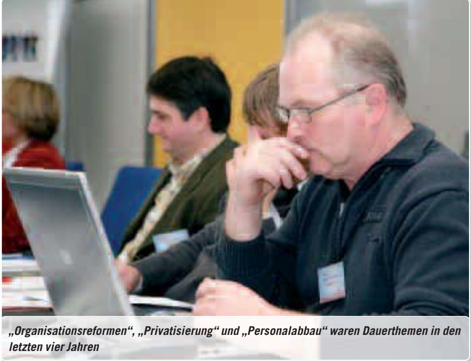
„Organisationsreformen“, „Privatisierung“ und „Personalabbau“ waren Dauerthemen in den letzten vier Jahren