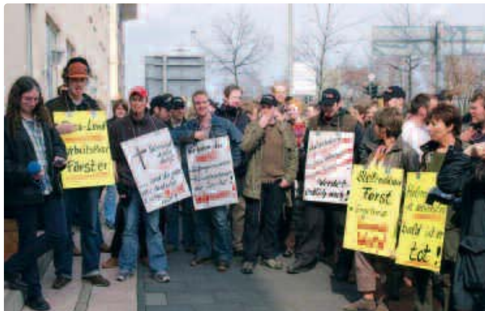
2005 wurde die Konferenz der Bundesvertretung in Göttingen von Protesten der Studentinnen und Studenten begleitet