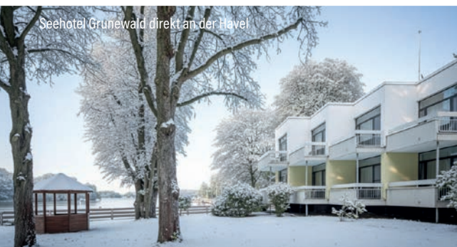
Seehotel Grunewald direkt an der Havel