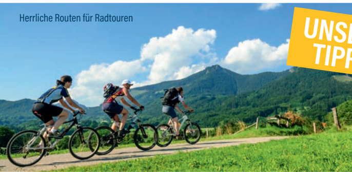
Herrliche Routen für Radtouren