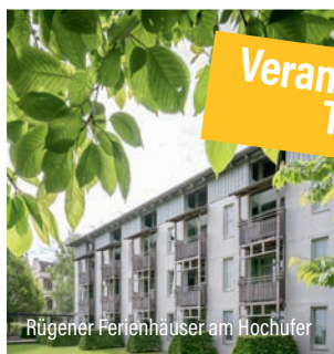
Rügener Ferienhäuser am Hochufer