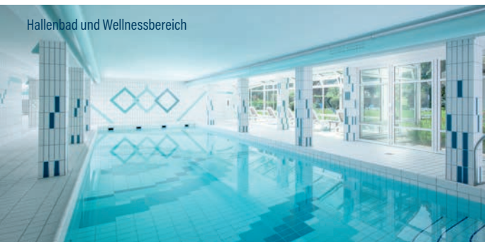
Hallenbad und Wellnessbereich