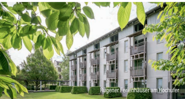
Rügener Ferienhäuser am Hochufer