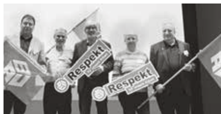
Frisch gewählt: der neue Bezirksvorstand