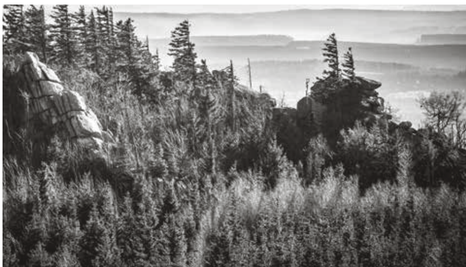
Der Harz – im Wandel der Zeit.

Montag, 14. September, 9 bis 17 Uhr. DJH-Jugendherberge Hannover, Ferd.-Wilh.-Fricke-Weg 1 Hannover. JAV-Wahlen 2026 – Stellung und Aufgaben des Wahlvorstandes. Anmeldung bei Fabian Berhorst: 0170 6184120 oder fabian.berhorst@igbau.de