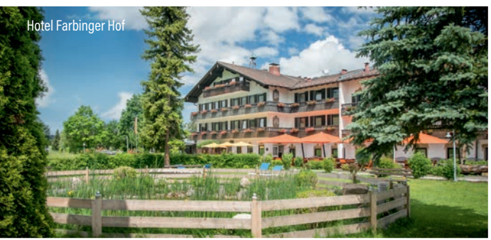
Hotel Farbinger Hof